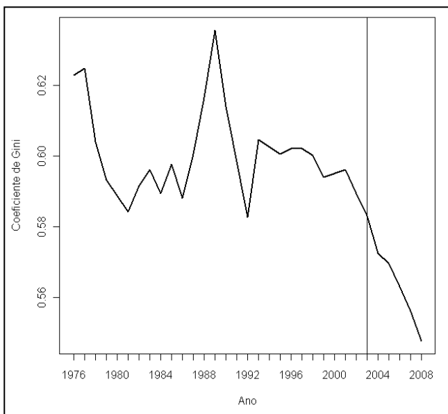
Figura 1 Evolução do índice de Gini no Brasil

governo. É suficiente notar que todos fizeram parte da agenda social do governo e que tiveram seus efeitos sobre a redução da pobreza somados em maior ou menor medida ao do Bolsa Família.