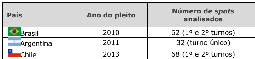
Tabela 1 Corpus empírico e pleito eleitoral de cada país analisado 1